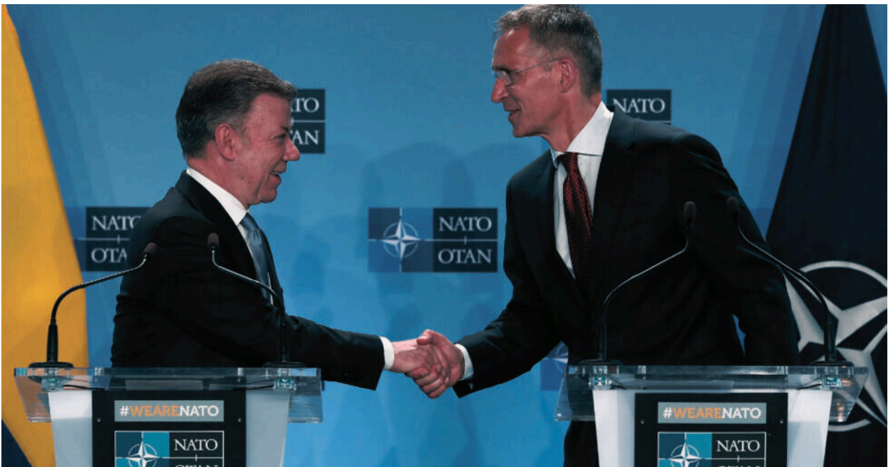
El expresidente de Colombia, Juan Manuel Santos durante el acto en el que su país se oficializó como socio global de la OTAN..

Colombia concretó su acercamiento a la Alianza durante el Gobierno de Juan Manuel Santos, quien el 31 de mayo de 2018, dos meses antes de dejar la Presidencia, oficializó en Bruselas junto al secretario general de la OTAN, Jens Stoltenberg, el acuerdo de cooperación que convirtió al país en “socio global” de la Alianza, hasta ahora el único latinoamericano en alcanzar ese estatus.