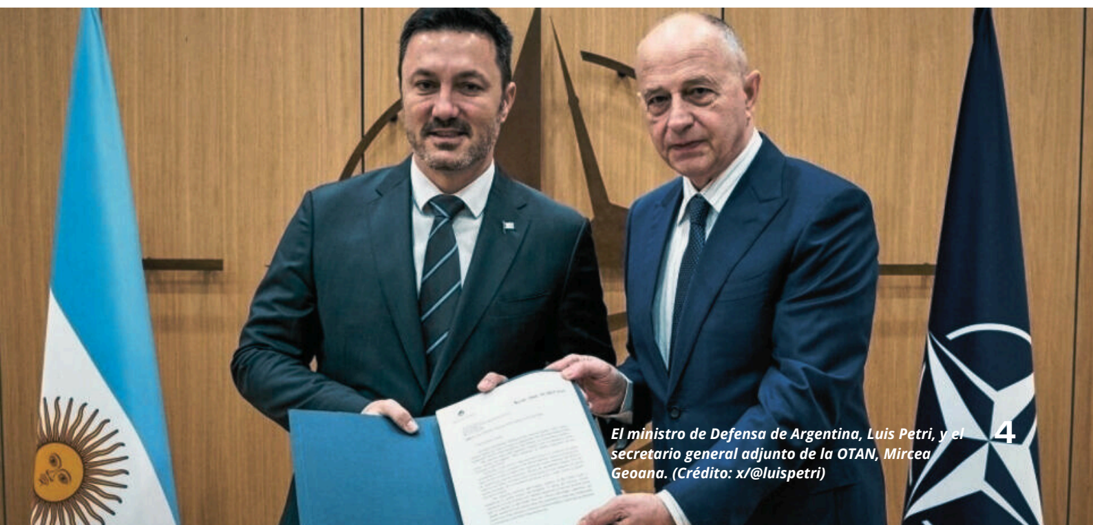
El ministro de Defensa de Argentina, Luis Petri, y el secretario general adjunto de la OTAN, Mircea Geoana.

No obstante, la decisión no ha pasado por entero desapercibido en una Argentina altamente polarizada. Pekín también ha redo-