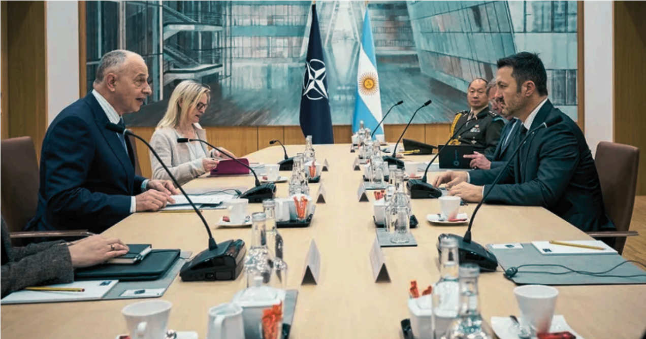
El ministro de Defensa de Argentina, Luis Petri, en la mesa de trabajo con el secretario general adjunto de la OTAN, Mircea Geoana.